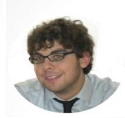
Canio Developer UI/UX Engineer